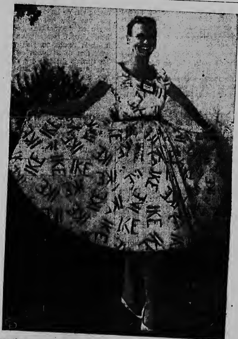
De Amerikaanse kleding-industrie werkt op volle toeren, niet alleen om normale textielgoederen af te leveren, maar ook om de politieke partijen te voorzien van propaganda-kleding. Een jurk die bij de sympathisanten van Eisenhower in trek is, laat geen twiifel bestaan over de mening van de draagster.

Welk een grote invloed de sport op de massa heeft blijkt uit onderstaand bericht. Het Engelse dagblad "News Chronicle" heeft bij zijn lezers een referendum gehouden: "Wat vond u de interessantste televisieuitzending uit de eerste helft van dit jaar?" De uitslag was: 1. de Cup-finales; 2. Florita Robson; 3. de variete-artist Eamon Andrews. Dit referendum betref de televisie-uitzendingen van de B.B.C. die, zoals men weet, er prat op gaat: hogere kunstwaarde te brengen dan de concurrende commerciële televisie. Het is wel een doorslaand bewijs hoezeer de massa door de sport wordt gegrepen, ook al beoefent het groots gedeelte hiervan zelf geen enkele tak van sport.